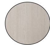
פורניר גוון לבחירת המעצבת